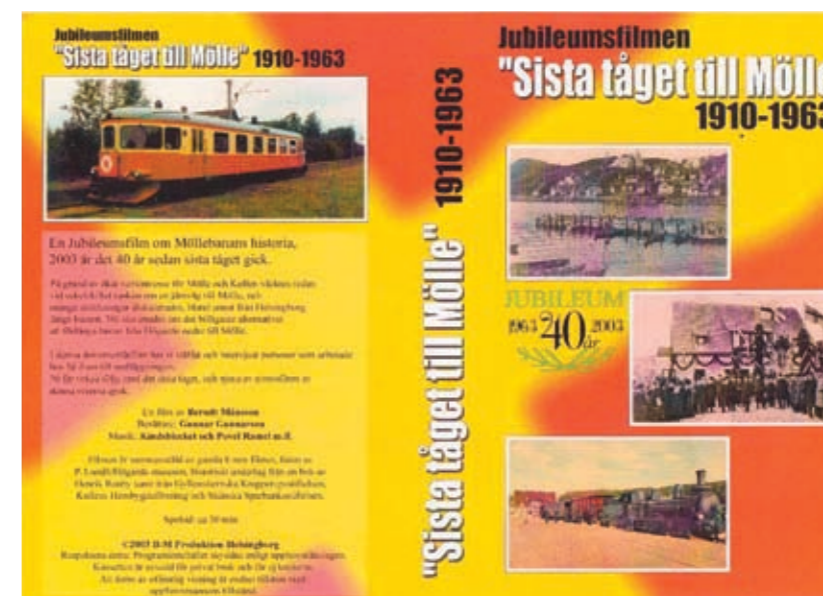
Omslaget till filmen