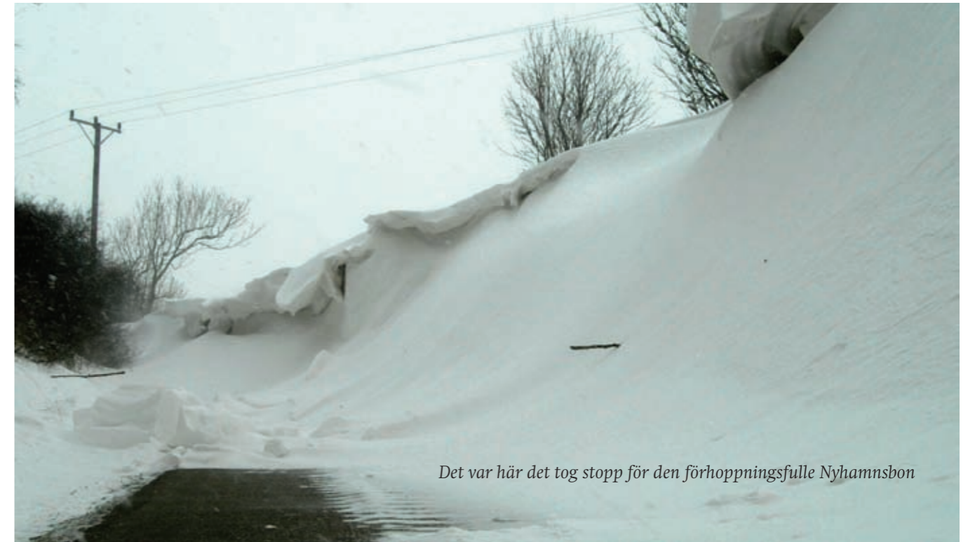
Det var här det tog stopp för den förhoppningsfulle Nyhamnsbon

Den här lilla berättelsen ur det verkliga livet kan kanske roa någon i Nyhamn – i synnerhet med tanke på den diskussion som för några år sedan fördes t.o.m i riksmidia om kvinnors rätt att vara med i byalaget. Den är visserligen några år gammal och från en annan årstid, men var på er vakt: Snön kan komma även i vinter och den nedan omtalade Nyhamnsbon gör fortsatta dagliga turer till Bräcke.