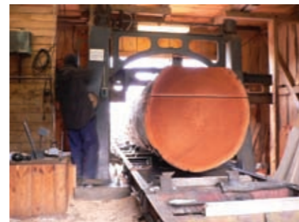
En rejäl mahognystock sågas.

19 - fots landskronasnipa, originalet byggt på Gustafsson varv i Landskrona.