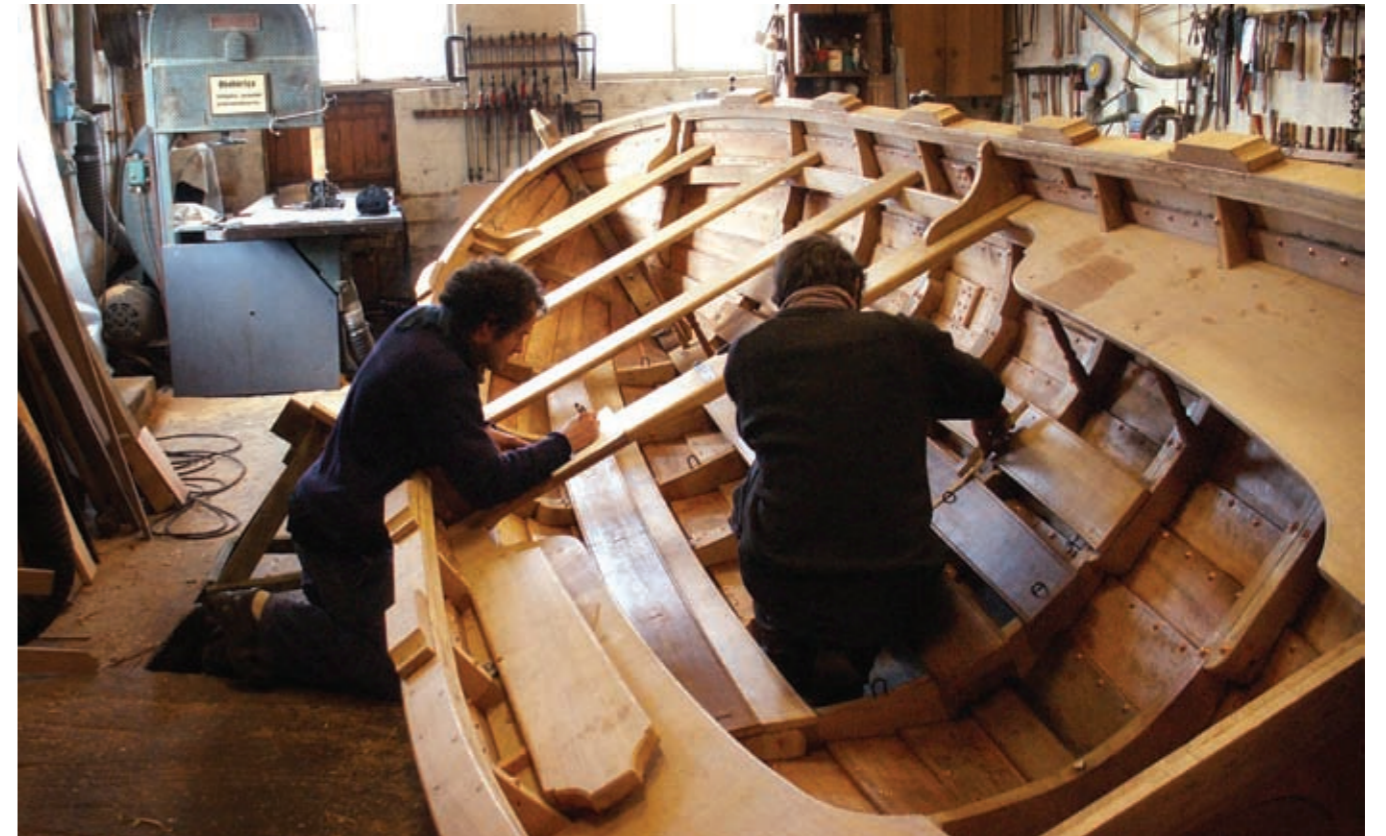
Bröderna bygger en av Ostindiefararens livbåtar.