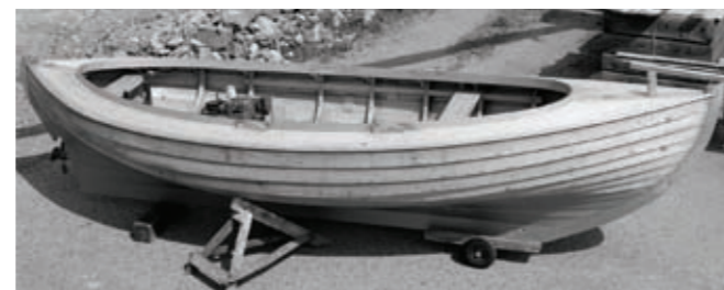
19-fots landskronasnipa, originalet byggt på Gustafsson varv i Landskrona.